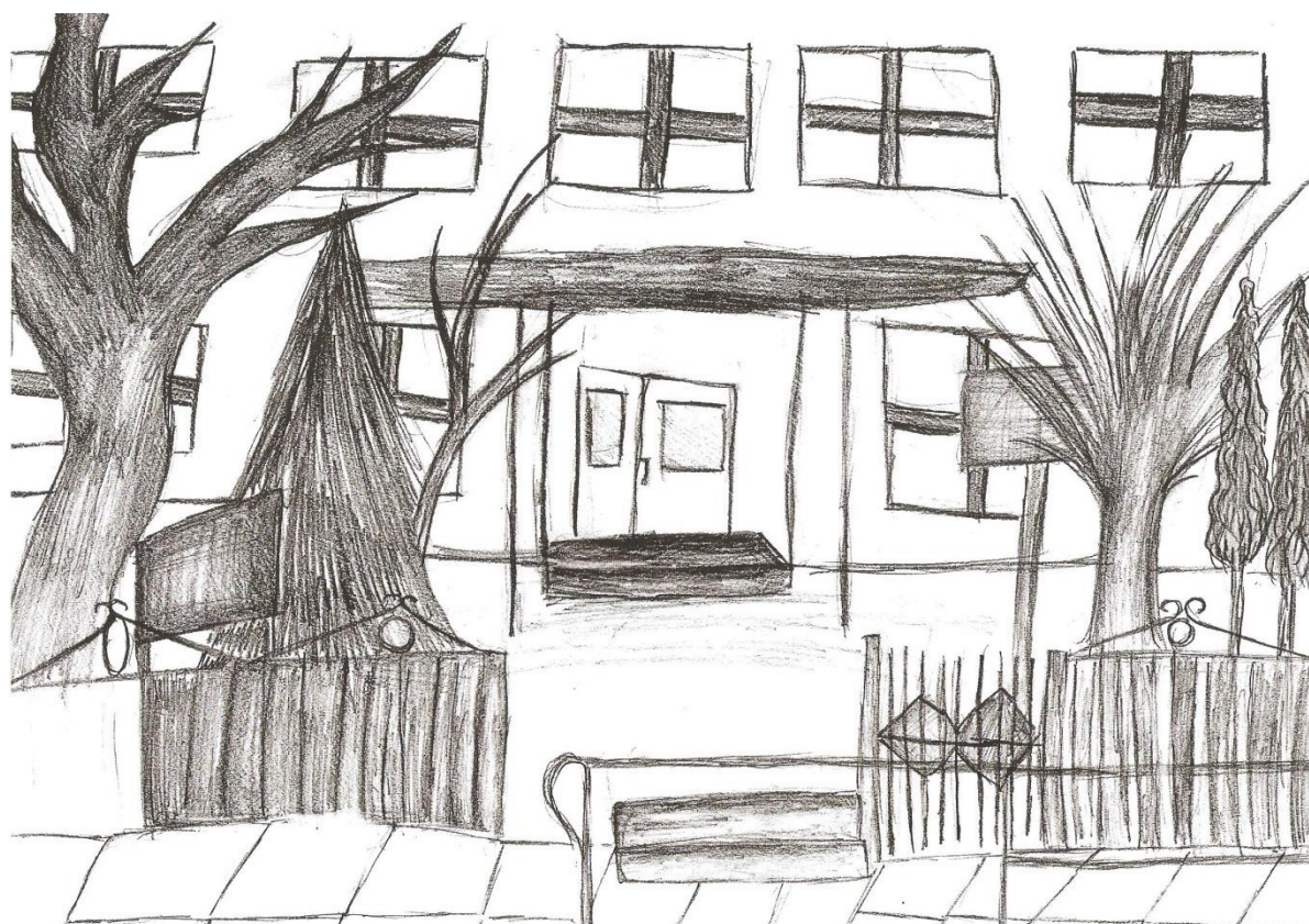
Praca wyróżniona w konkursie plastycznym „Moja szkoła” – Amelia Latazewicz, kl. IV